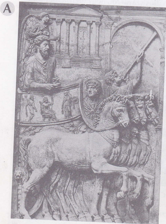
Marcus Aurelius diadalmenete. A császár triumphatori kocsján a Capitoliumra vonul. A háttérben a Forum építményei láthatók. (Museo Capitolino, Róma)

Dum tōtā urbe populus fēstum agēbat, triumphātor in Capitōlium ibat. Postquam aedem Iovis intrāverat, in quā iam omnis senātus aderat, corōnam et ōrnātūs dēposuit, et taurum immolāvit.