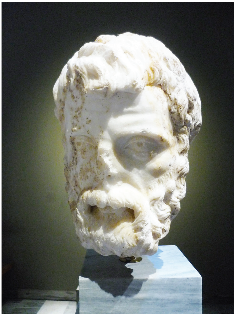
3. kép. Héródész Attikos portréja (Athén, Nemzeti Régészeti Múzeum)