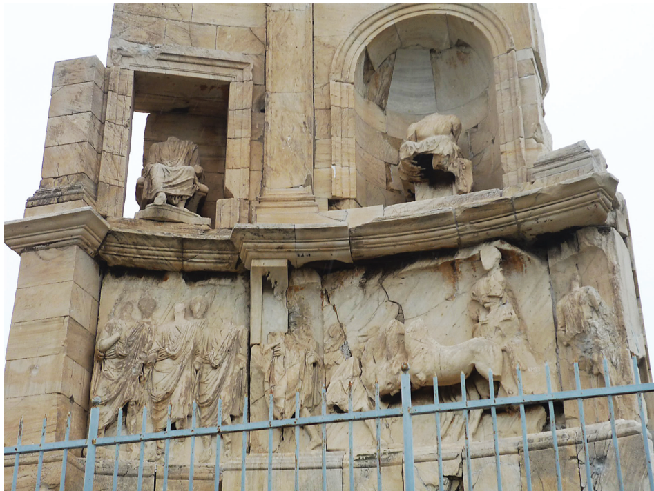
1. kép. Philopappos emlékműve (Athén, Múzsák hegye)